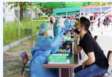
그림 2 현장 진단