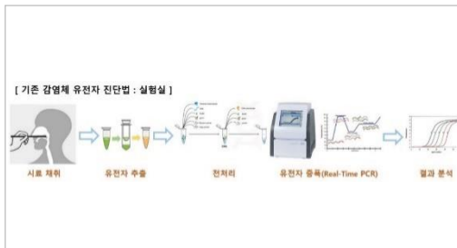
그림 1 기존 감염체 유전자 진단법:실험실