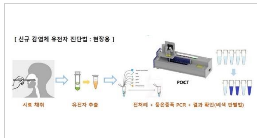
그림 2 신규 감염체 유전자 진단법:현장용